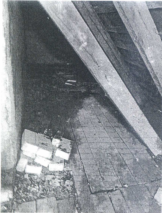
Załącznik F 17 Strych