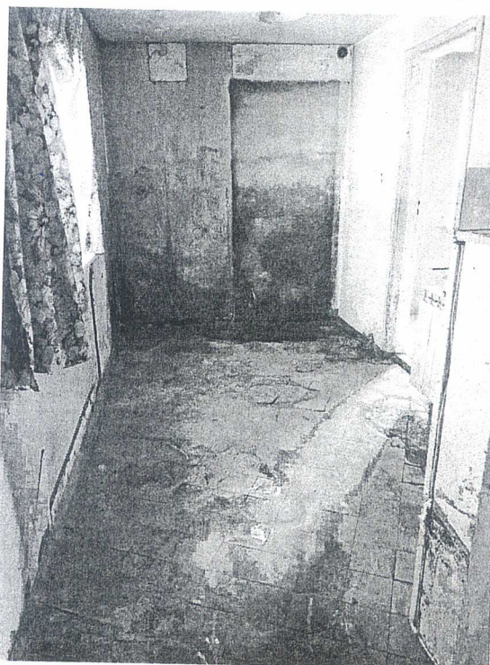
Załącznik F 11 Komunikacja