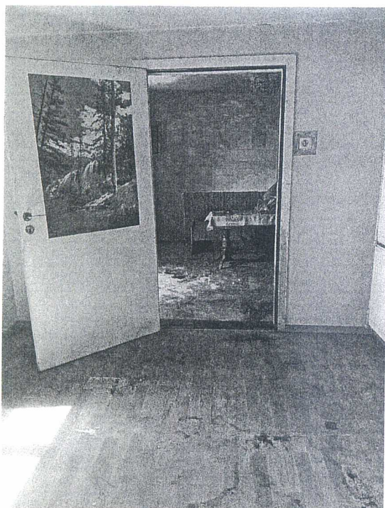
Załącznik F 13 Pokój 1