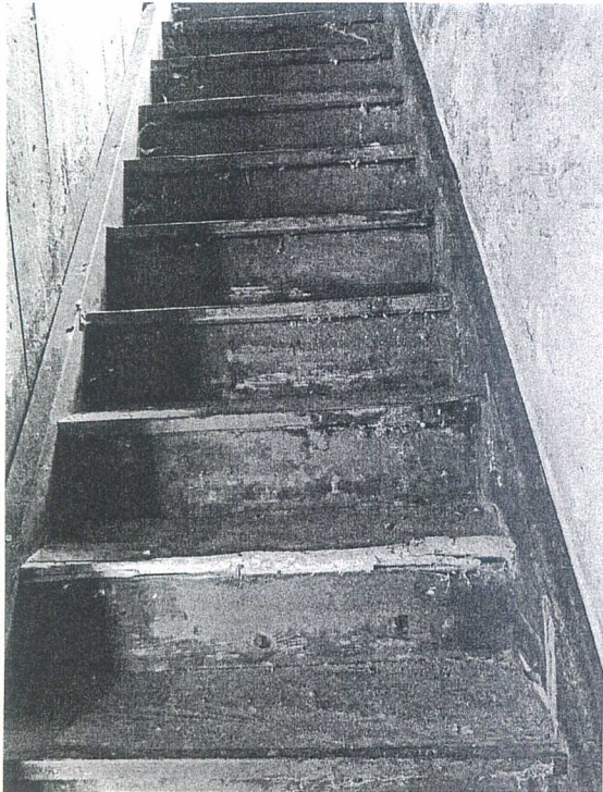
Załącznik F 15 Schody na poddasze